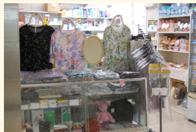
～お洋服もあります～