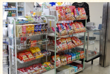
～豊富な種類のお菓子～